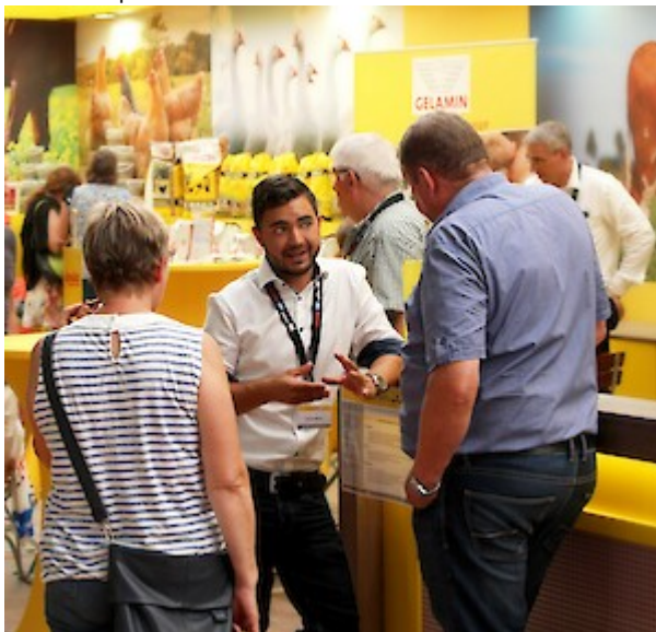
In vielen Themen zuhause: Fachberater im Gespräch.