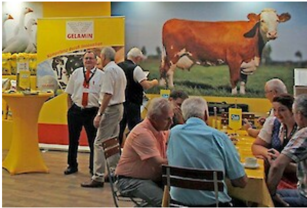
Intensive Gespräche an unserem Gemeinschaftsstand.