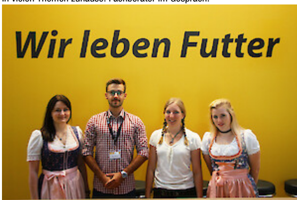
„Wir leben Futter“ – Unser Team auf dem Stand der Rottalschau 2019.