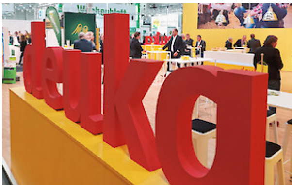
deuka - Auch auf den AGRAR Unternehmertagen 2022 unsere wichtigste Marke zur Versorgung von Schweinen, Rindern und Geflügel.