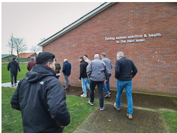
Impressionen vom deuka-Prestarter-Workshop in den Niederlanden