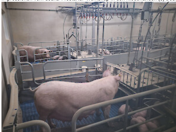
Impressionen vom deuka-Prestarter-Workshop in den Niederlanden