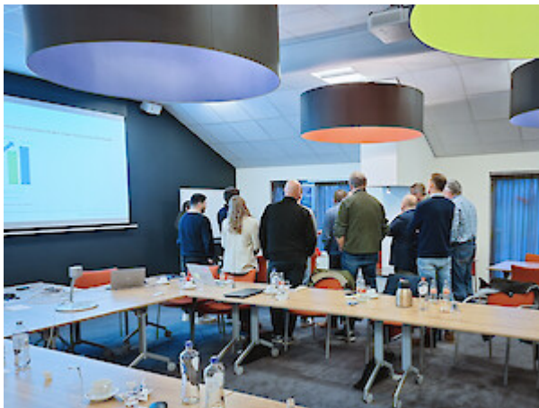
Impressionen vom deuka-Prestarter-Workshop in den Niederlanden