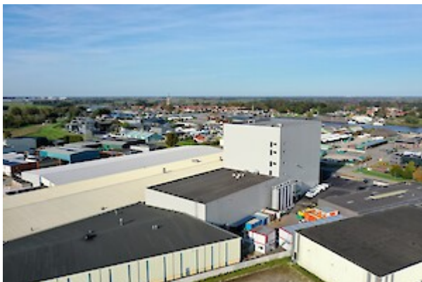
Das provimi-Werk in Hasselt (Niederlande) Moderne Produktion auf höchstem Niveau.

Zum Abschluss des ersten Tages stellte Sven Lorenz aus dem operativen Vertrieb (Zentrale Verkaufsorganisation) die geplante Verkaufsaktion für Prestarter , die den ganzen Februar hindurch stattfindet vor: Beim Kauf von zehn Prestarter-Säcken erhalten unsere Kundinnen und Kunden im Februar einen Sack gratis dazu. Der offizielle Startschuss fällt auf die Agrar-Unternehmertage in Münster Anfang Februar.