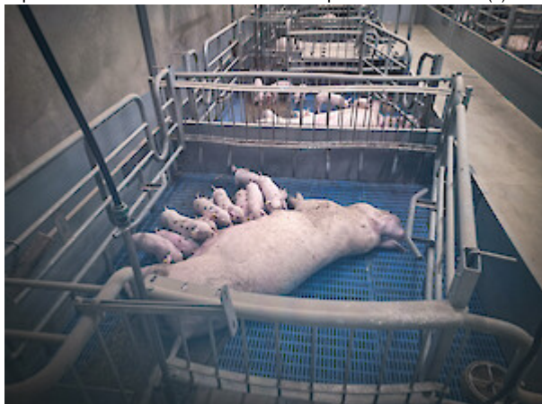
Impressionen vom deuka-Prestarter-Workshop in den Niederlanden